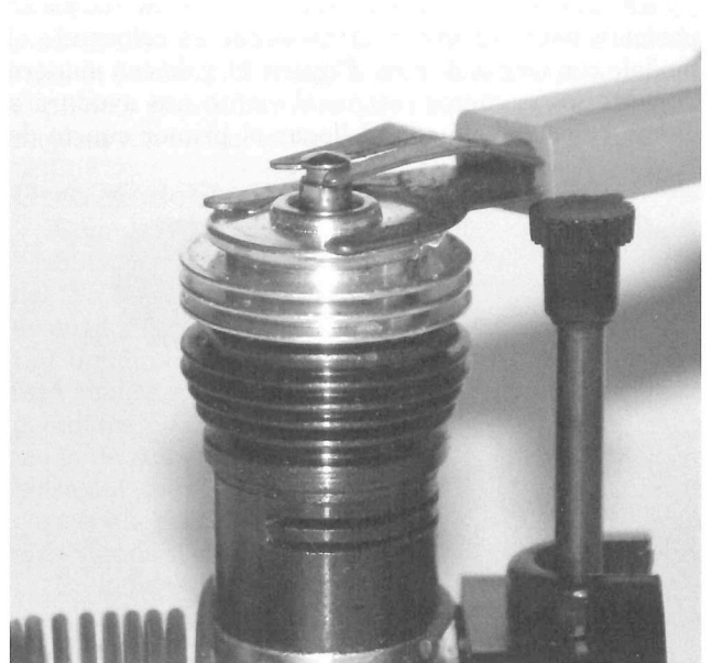
Aquí se muestra un clip original Cox , ya conectado para encender la bujía glow. Nótese que las dos patitas superiores hacen contacto con la torre superior de la bujía, mientras que las otras dos patas (más abiertas) se apoyan sobre la base exterior.

El despegue (también llamado "decolaje"), es la maniobra de la cual dependerá al menos el éxito de la primera parte del vuelo. No es difícil, y solamente debemos tener en cuenta ciertos aspectos. Entre ellos, el más importante es la posición inicial del modelo respecto a la dirección del viento.