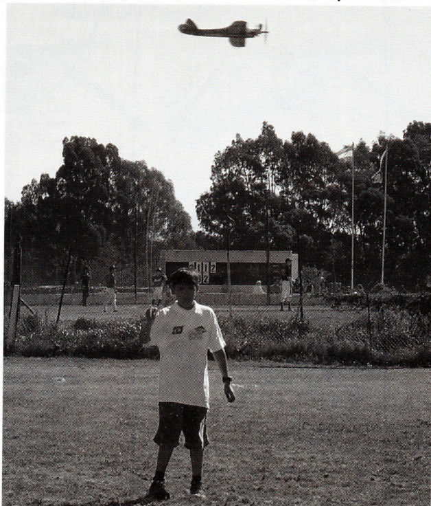
Muchos son quienes ya poseen un motor Cox .049 , y para ellos se publicarán planos y sugerencias en sucesivas ediciones de esta revista.